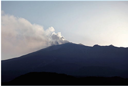
噴火後2日たった29日夕方噴煙の勢いを保つ

9月27日の御嶽山噴火で、長野県では物流、ライフラインなどに大きな影響は出ていないものの、噴火の長期化に伴った農作物へ降灰被害が懸念されている。火口から北東約10kmの開田高原に工場、直売店などを構える、そば製造などの霧しなでは、施設設備や人的な被害はないものの、収穫の最盛期を迎えている地元産玄そばに火山灰が降った。