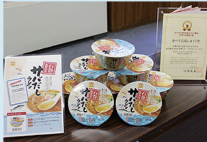
(日本食糧新聞社 http://news.nissyoku.co.jp/ より)

この商品は11月、フード・アクション・ニッポンアワード2014「食べて応援しよう！賞」を受賞した。このような経緯の中、ご当地ラーメンを多く手掛ける東洋水産が開発に乗り出した。「石巻焼きそばで知られる地元製麺業、島金さんの商品を取り寄せて試食したが、スープにくせがなく、カップ麺でいけると思った。おいしい味が出来上がっているのができた」(即席麺本部開発1課・神永憲課長)。風味豊かなあっさりスープが特徴。全国発売されたが、流通の反応もいい。ノンフライ麺で税抜き小売価格200円。販売目標は100万食。