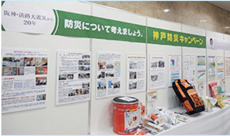
防災キャンペーンパネル展

同社は、これからも創業の理念である「For the Customers」の精神の通り、地域の一員としての責任を果たしていくとしている。