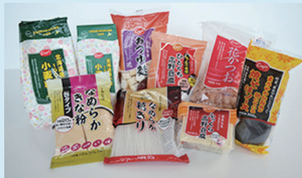
みやぎ生協に並ぶ COOP 商品

みやぎ生協が「絆フェア」で取り扱った商品は、「COOP'S 北海道産小麦100%小麦粉900g」188円、「同なめらか葛きり90g」138円、「同なめらかきな粉分タイプ100g」148円、「同花かつお」208円、「同フルーツパウンドケーキ」322円。