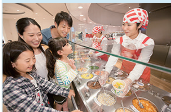
マイカップヌードルファクトリー

また、来場者のニーズを調べながら新しい展示や企画を絶えず織り交ぜ、周辺施設などコミュニティーとの連携によって集客力を高めている。毎年実施している横浜市の小学5年生を対象とした校外学習や、防災備蓄用インスタントラーメンの提供、横浜市文化観光局との連携など、横浜市の協力関係強化で社会貢献および地域貢献も果たしている。また、インバウンドによって3～8月の外国人来館者比率は全体の9%に高まっている。