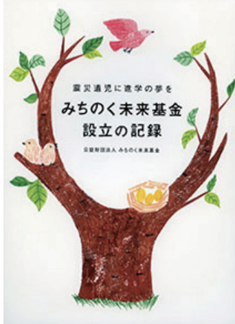
基金設立記録を小冊子にまとめた