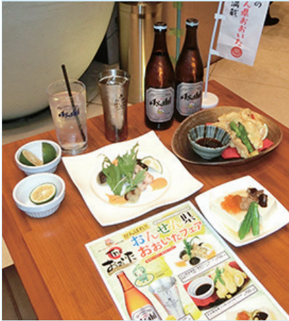
県産カボスや椎茸を使った特別メニュー

県内限定の「スーパードライ おんせん県おおいたラベル」は2015年7月1日から12月末までで6万ケース(大瓶換算)を販売するなど好評。2年目の今年は4月からの発売で年内に10万ケースを計画する。7月1日～10月末までは販売分1本につき1円を大分県の被災者支援のために寄付する。