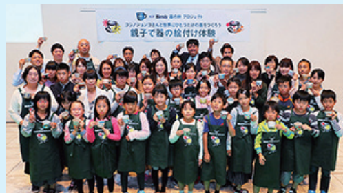
世界に一つの器ができた

キャンペーン期間は2月22日から1次締め切りが3月21日、2次締め切りが4月10日まで。A賞は楽天イーグルス軍公式戦観戦ペアチケットを120組240人に。B賞は青森県南部名久井焼見学院窯、宮城県堤焼乾馬窯、同末家焼ひろ窯、福島県会津本郷焼宗像窯のカップとソーサーを2客セットで50人にプレゼント。