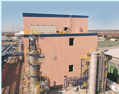
新工場は最新鋭のウエットミリング工場となっている