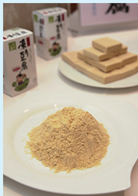
機能性認知の拡大や用途拡大でこうや豆腐は新たなステージへ上りつつある

ただ、高止まりが続く原材大豆の価格や上昇する人件費、物流費など、コスト環境はさらに厳しさを増し、業界はさらなる機能性の追求や健康効果を促す食べ方・メニューの訴求など、収益性向上を伴った新価値創出を急ぐ構え。誕生から1,000年近い歴史が培ってきた潜在需要を、現代の健康志向やライフスタイルにマッチした手法で呼び起こそうと、こうや豆腐は進化を続けている。