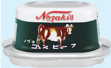
新容器の採用で生まれ変わった「ノザキのコンビーフ」

JFE 商事グループの川商フーズは15日、主力商品「ノザキのコンビーフ」の「枕缶」での販売を終了し、新パッケージへリニューアルすると発表した。約70年にわたって親しまれてきた「巻き取り鍵」で開封する形態から、開けやすいシール蓋採用のパッケージへ変更。昨今の家族構成に合わせた容量変更、容器のバリア性の向上で賞味期限も延長するなど、より使いやすい商品として販売する。