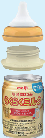
「明治ほほえみらくらくミルク」と専用アタッチメント

明治は11月25日、乳児用液体ミルク「明治ほほえみらくらくミルク」と、哺乳瓶用乳首を取り付けてそのまま授乳ができる専用アタッチメントで育児誌の編集部が選ぶ「ペアレンティングアワード2020(モノ部門)」を受賞した。常温長期保存が可能で調乳が不要で、どんな状況でもミルクをあげられる安心の提供が評価された。