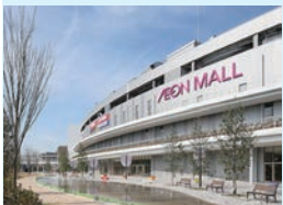
19年に続き2回目の実証実験を行うイオンモール堺鉄砲町

イオンは、イオンモール堺鉄砲町(大阪府堺市)で来店客の電気自動車からショッピングセンター(SC)で使用する電力を調達する実証実験に取り組んでいる。19年に同SCで実施した取組みに続くもので、今回は12日間で19人の一般モニターが参加した。