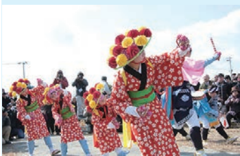
4月3日放送予定の「踊るふるさと～神戸の安波祭」(福島県)

ダイドーグループホールディングス (GHD) は、1月23日から毎週土曜日の4月10日まで、「災害を乗り越える祭りの力」をテーマに、被災後も祭りとともに、たくましく生きる各地の人々を描いたドキュメンタリー映像作品をBS12トゥエルビで、12週連続で放送している。