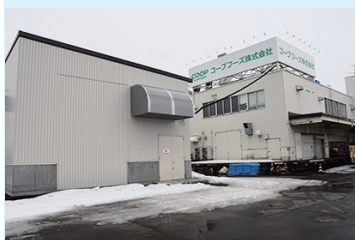
手前の施設が工場横に建設された発電設備

コープさっぽろ関連会社のコープフーズ石狩工場で16日、新エネルギー設備「オンサイト発電によるBCP（事業継続計画）サービス」第1号施設が完成し、竣工式と見学会が開催された。トドック電力（コープさっぽろ関連会社）のガスをもとに、排熱を利用する高効率コージェネレーション（熱電併給）システム発電装置1基と小型高効率ボイラー3基を使用することで、常時のエネルギー使用量約20%削減と非常時のBCP対策を両立する発電が可能となり、停電時でも弁当や惣菜を生産し避難所などに供給できる。