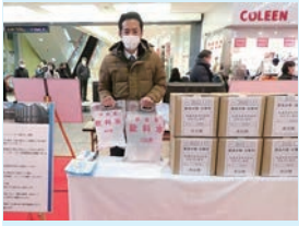
取組みを紹介する神戸酒心館のブース

阪神・淡路大震災の発生から27年を迎えた17日、神戸市主催の防災関連イベントが三宮センター街（同市中央区）で開かれた。災害発生時に同市、神戸酒心館、日産自動車と連携し、EV（電気自動車）を使用し神戸酒心館が確保している非常用の飲料水を地域住民に届けることを決めた災害連携協定の取組みを紹介した。