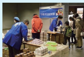
「手作り缶詰体験会」は子どもにも人気だった

会場では「北海道産 ほたて水煮」（海洋食品）、「ふらの 茹小豆」（マルハニチロ北日本）、「ゆであずき」（クレードル興農）、「日食スイートコーン」（日本食品製造）など7社16品を販売。以前は試食も行われ人気を博していたが、コロナ感染拡大の影響で2020年から試食を中止し販売のみとした。