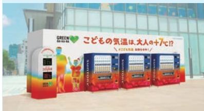
ビジュアルで分かりやすく啓発する「こども気温お知らせ自販機」

サントリー食品インターナショナルは夏本番を前に、小さな子ども特有の暑熱環境「こども気温」に着目した、親子の熱中症対策をサポートするための啓もう活動や情報発信を積極化している。気象専門会社ウェザーマップと共同検証実験を5月に実施。地面からの照り返しの違いなどにより、子どもの身長で計測した気温が大人より約7℃高いことを確認した。このことを重視し「こども気温」と称して一般化を図っていく。